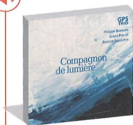
Compagnon de lumière GPS Trio ADF Musique 1 CD - 14 titres Sortie : mai 2020